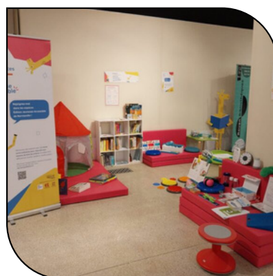
Stand de N2L au Fêno en 2025